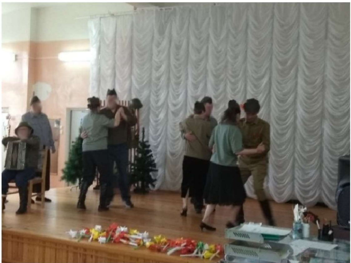
2. Вокальная студия «Ветер перемен»: навыки и умения, полученные на занятиях в театральной студии, с успехом применяются и на уроках вокала.